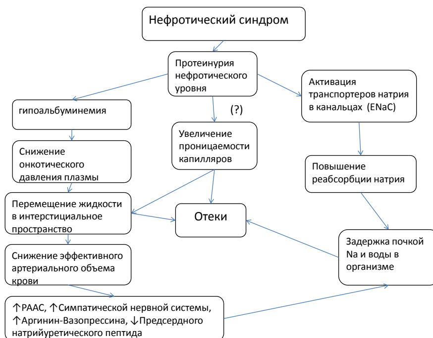
Рисунок 2. Схема патогенеза отеков при нефротическом синдроме

Однако этот, ставший уже классическим, механизм не является ведущим при развитии нефротических отеков. Известно, что не всякая гипоальбуминемия сопровождается отеками и значимым для их появления является уровень альбумина в плазме менее 15- 20 г/л, а у пациентов с генетически обусловленной анальбуминемией задержки натрия и отеков нет или они лишь умеренные, несмотря на низкое онкотическое давление плазмы крови. Обнаружено также, что задержка натрия при развитии обострения БМИ и появлении нефротической протеинурии выявляется ещё при нормальном содержании альбумина крови, в то время, как при развитии ремиссии, натрийурез появляется одновременно со снижением протеинурии, ещё при сохраняющейся выраженной гипоальбуминемии. Согласно современным представлениям, «первичный дефект», приводящий к задержке натрия, находится не только в клубочке, но и в канальцах, и обусловлен, наряду с активацией РААС, также и активацией транспортеров натрия в канальцах патологически фильтруемым белком. Обнаружено нарушение транспорта натрия в различных участках нефрона, в том числе Na/K-АТФазы эпителия дистального нефрона, Na-H котранспортера (NHE3) проксимального канальца и активация эпителиального натриевого транспортера (ENaC), расположенного в кортикальных собирательных трубочках, рассматриваемого в настоящее время, как основной фактор задержки натрия при