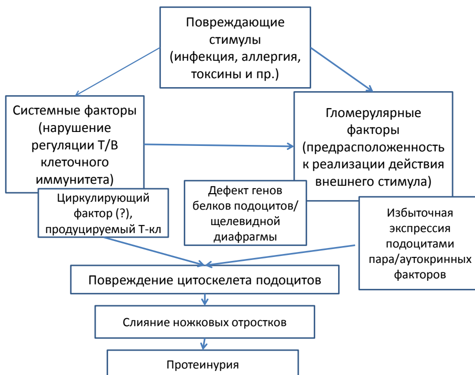
Рисунок 1. Схема возможных патогенетических механизмов развития БМИ

В экспериментальных исследованиях обнаружено также, что при БМИ подоциты не только являются объектом повреждения, но могут и приобретать провоспалительный фенотип и экспрессировать трансмембранный белок CD80, также известный как B7.1, являющийся ко-стимулирующей молекулой Т-клеток. Повышенная экспрессия CD80 подоцитами ассоциируется с протеинурией. Возможно, что неэффективный контроль экспрессии CD80 на подоцитах под воздействием либо циркулирующих цитокинов, либо микробных продуктов, либо аллергенов, при наличии функциональной недостаточности Т-регуляторных клеток, выявляемой при БМИ, может быть одним из патогенетических механизмов развития БМИ. В большинстве случаев идиопатической формы, БМИ, по-видимому, не имеет единой этиологии и возникает при взаимодействии генетических и иммунологических факторов, причем вероятный дефект подоцитов и щелевидной диафрагмы вызывает предрасположенность к повреждающему действию иммунологических стимулов (Рис.1).